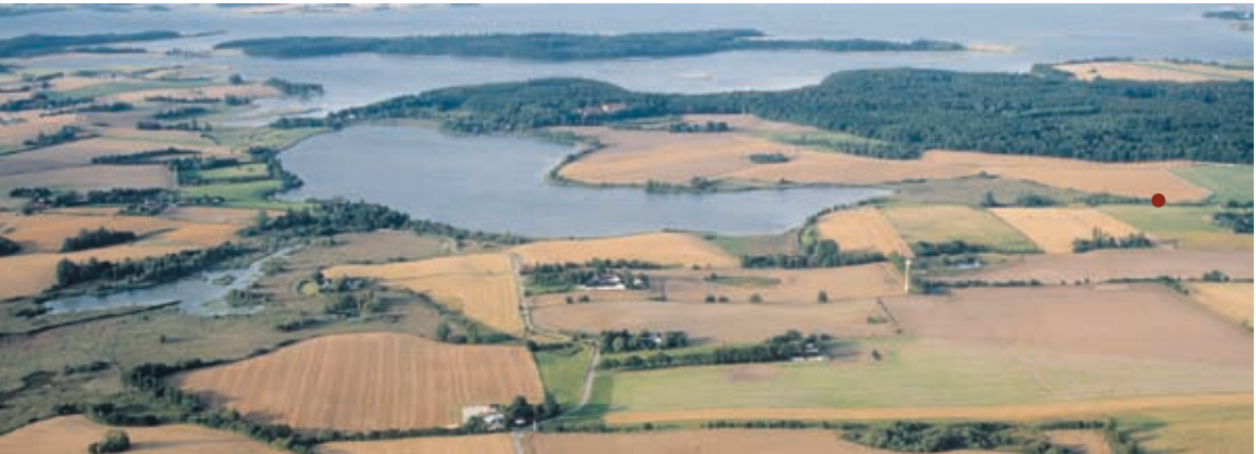
Kattinge Sø, med Kattinge Vig og Bognæs i baggrunden. Ved den lille røde prik løber Gedevalsrenden.

Svogerslev Sø (24), udsigten (25) og Dømmes Mose (26) Information på stedet.