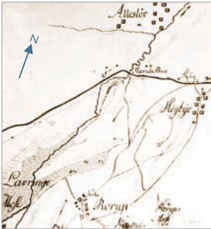
Alfarvejen, kort fra 1779

stendynge. For at komme sikkert over, lagde folk en sten til de magter, der rådede over vandløbet. Harrevad ses på det lille kort fra 1779.