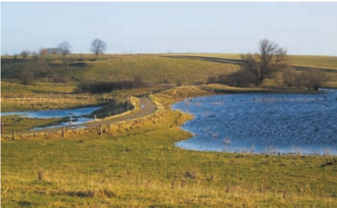
Dæmningen set fra Hestebjerg

Københavns Energis vandværk (14) Vandværket opførtes af det daværende Københavns Vandforsyning i 1937. Der indvindes vand fra 7 kildepladser omkring Lejre. Oprindelig var det tæt på 16 mill. kubikmeter årligt. De senere års vandbesparelser har betydet, at der i dag kun ind